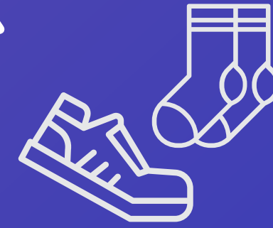
حذاء مشي مريح و جوارب قطنية WALKING SHOES COTTON SOCKS