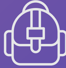
شنطة ظهر BACKBAG