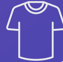
ملابس قطنية COTTON SHIRTS