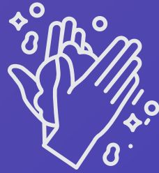
العناية الشخصية PERSONAL CARE STUFF