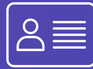
الهوية الشخصية ID CARD