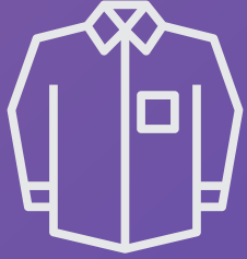
جاكيت خفيف LIGHT JACKET