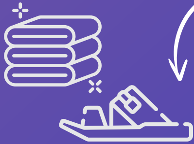
منشفة خاصة ونعال TOWELS & SLIPPERS

HERE ARE SOME IMPORTANT ITEMS YOU NEED ON YOUR TRIP